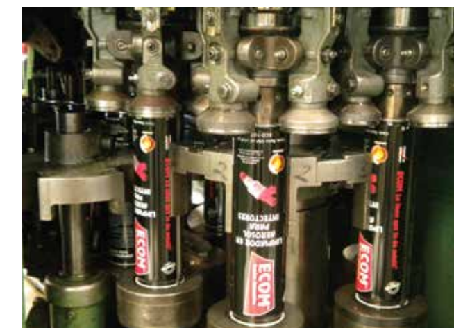
Cerrando el fondo del bote