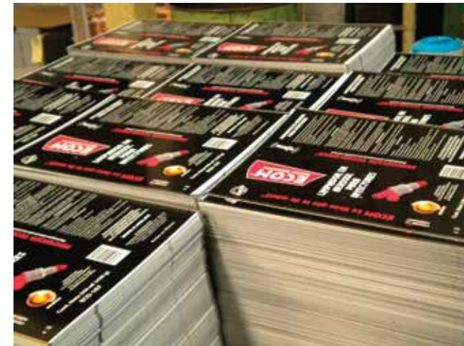
Lamina impresa que forma el cuerpo del envase