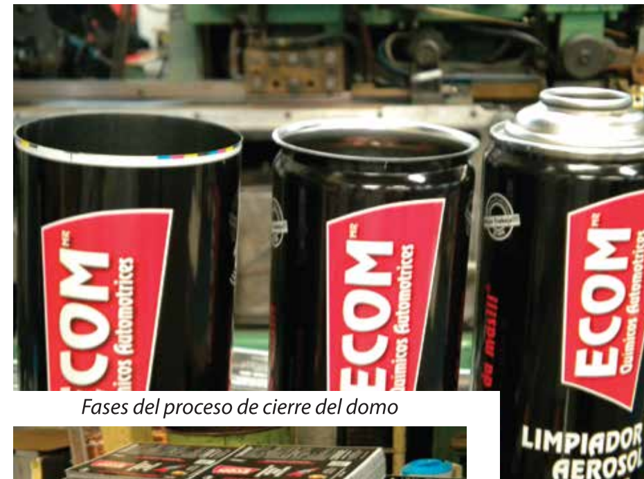
Fases del proceso de cierre del domo